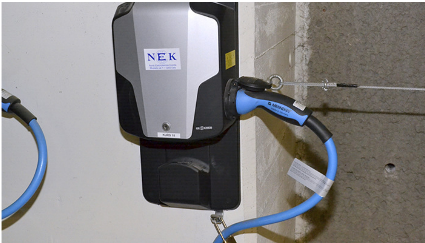
Mode 3 På-vegg-lader med Type 2 kontakt