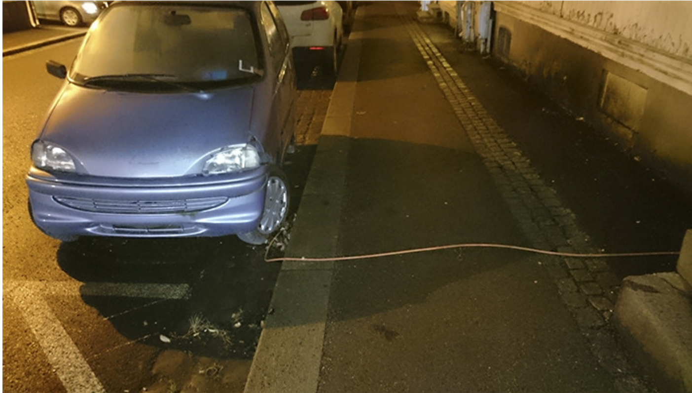
Elbil med kabel over fortau, langs vegg og inn vindu