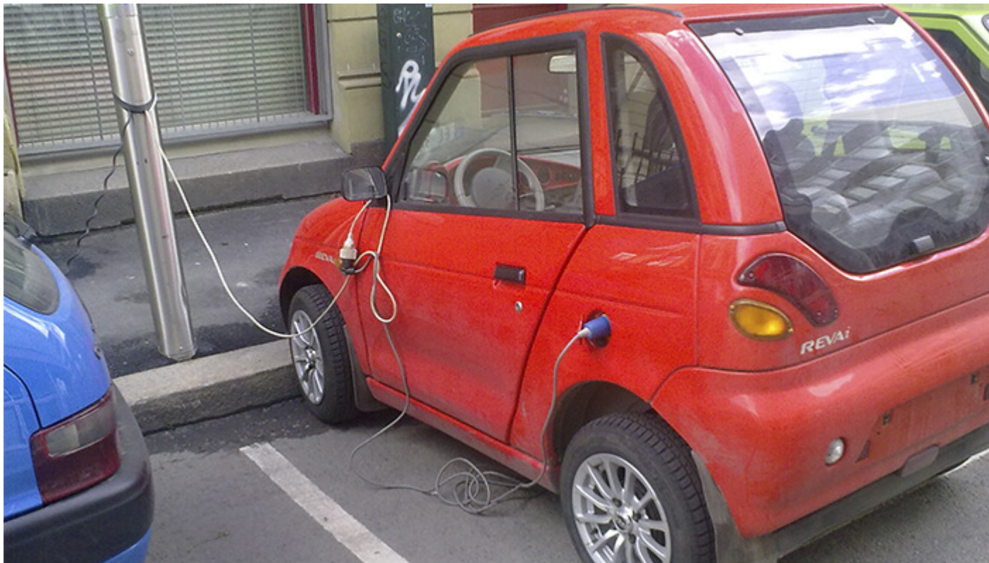
Skjøteledning på ladekabel