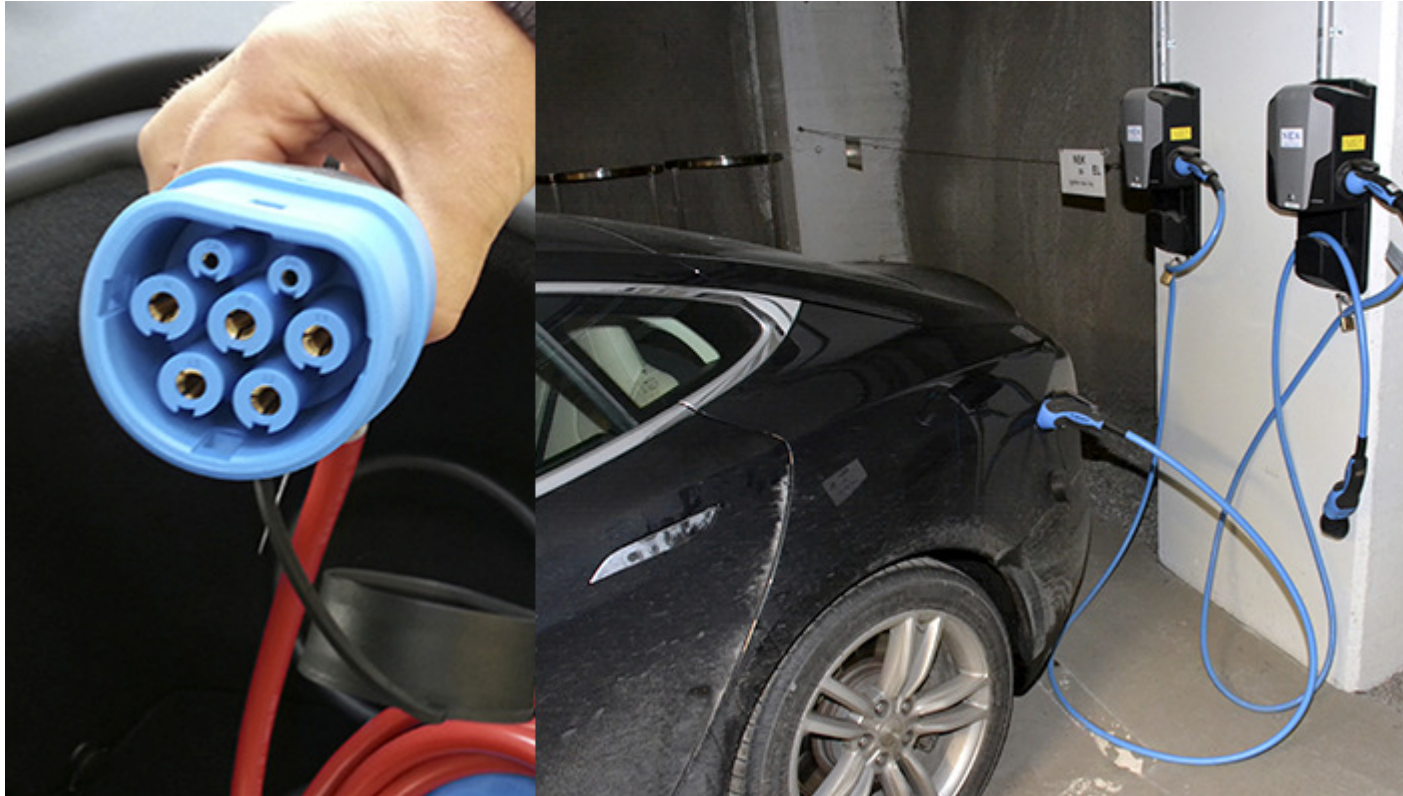
Fra venstre: Type 2 kontakt (Mennekes kontakt) og bil til mode 3 lading med løs type 2 kabel.